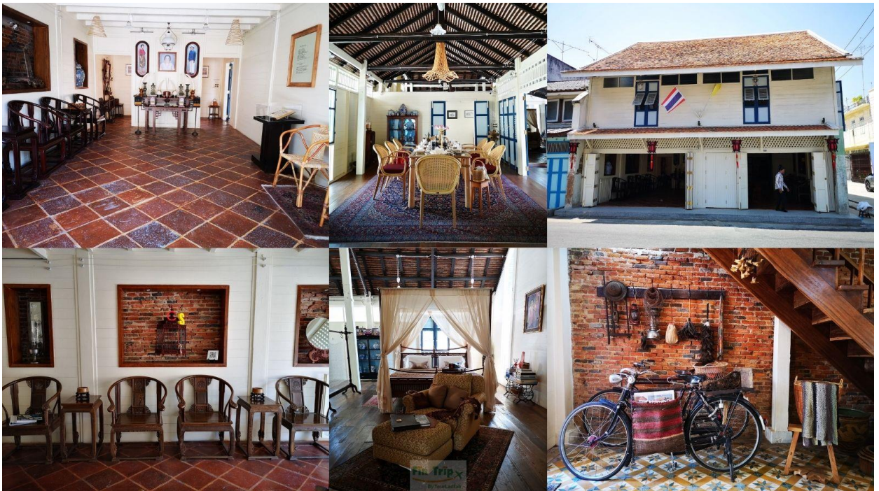
ศาลเจ้าแม่ลิ้มกอเหนี่ยว

ไกด์รอรับคณะที่ สนามบินหาดใหญ่ ให้ท่านรับสัมภาระให้เรียบร้อย ไกด์นำเที่ยวรอท่านอยู่ด้านนอกที่จุดนัดพบ จากนั้นนำท่านออกเดินทางสู่จังหวัดปัตตานี โดยรถตู้ปรับอากาศ (ระยะทาง 118 ก.ม. ใช้เวลาเดินทาง 2 ชั่วโมง โดยประมาณ) จากนั้นนำท่านชม ศาลเจ้าแม่ลิ้มกอเหนี่ยว เชื่อกันว่าผู้มาขอพรให้โชคลาภจะได้ผล หรือแม้แต่การค้าขายที่ซบเซาหรือขาดทุนก็กลับรุ่งเรืองขึ้นจนทำให้เกิดความนับถือศรัทธาอย่างมาก ชาวปัตตานีจึงได้นำต้นไม้ที่ลิ้มกอเหนี่ยวผูกคอตายมาแกะสลักเป็นรูปบูชาและสร้างศาลเจ้าขึ้นสักการะ สำหรับองค์เจ้าแม่ลิ้มกอเหนี่ยว ท่านเป็นเทพเจ้าแห่งความเมตตาโชคลาภค้าขาย ซึ่งเป็นที่นิยมมากราบไหว้ของพรเพื่อเป็นสิริมงคลกับชีวิต